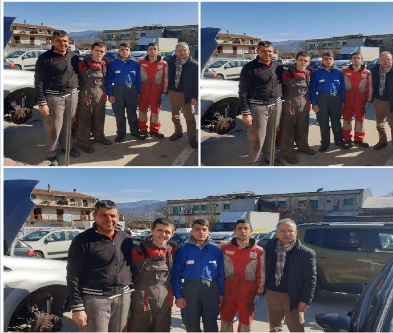
Alternanza scuola lavoro presso Officine della zona Industriale di Rende