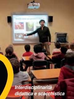
Interdisciplinarietà didattica e scacchistica