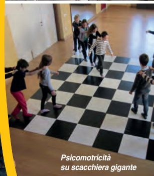
Psicomotricità su scacchiera gigante