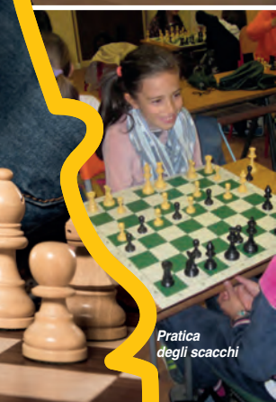
Pratica degli scacchi